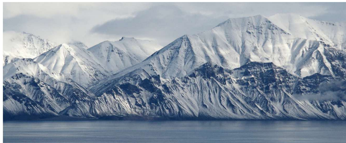
Montañas costeras, TINMCA