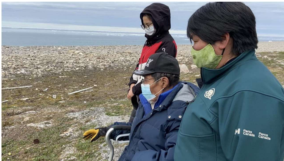
Anciano con estudiante y personal, TINMCA